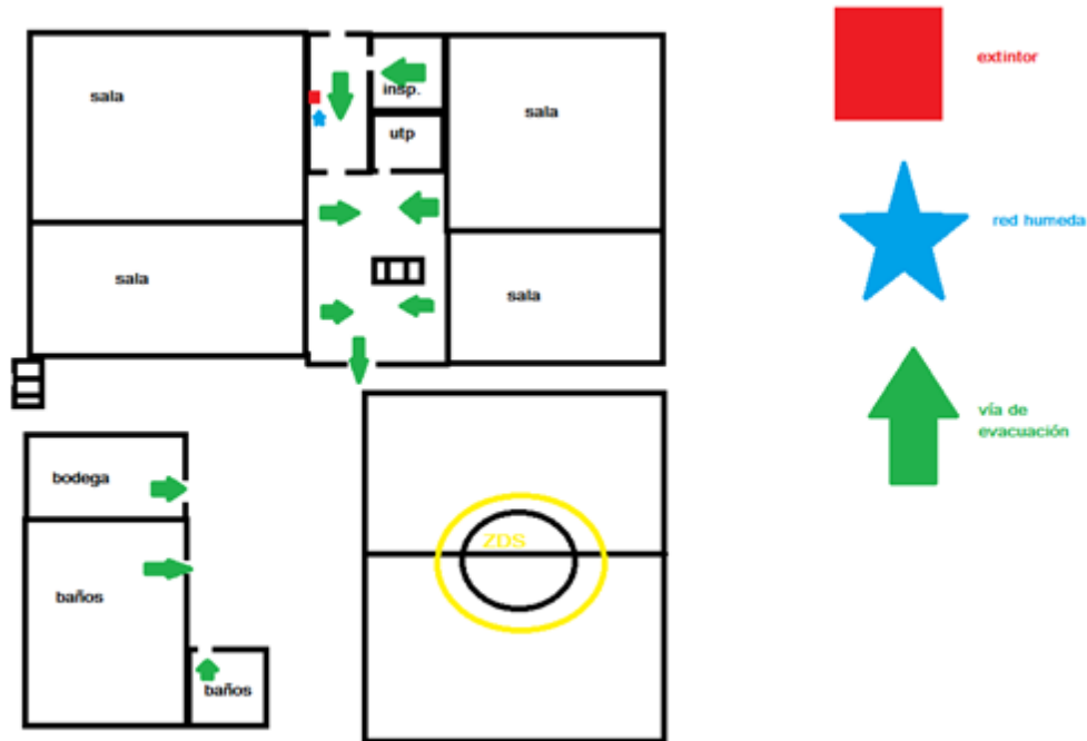
basica 2do piso